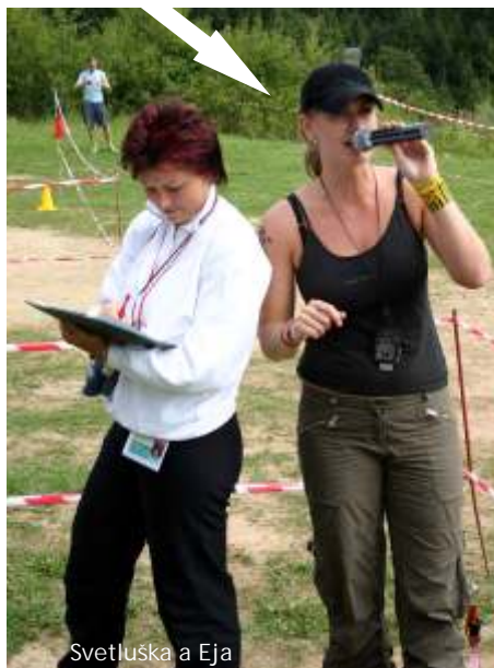
Svetluška a Eja

Čo robíš, keď nie je Tralaland? Organizujem školy v prírode a keď nie sú ani školy v prírode, chodím po Slovensku.